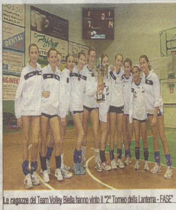
Le ragazze del Team Volley Biella hanno vinto il "2° Torneo della Lanterna - FASE"